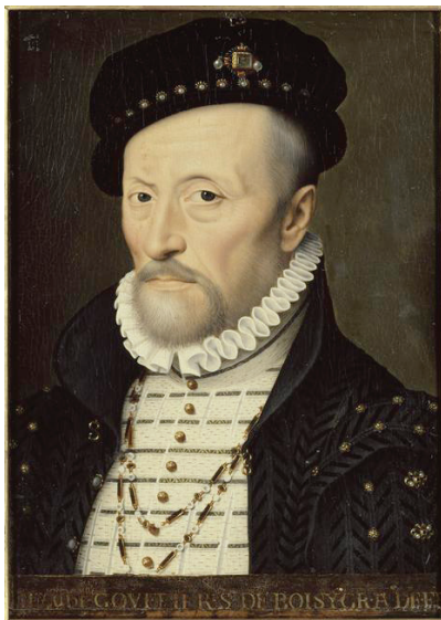
> Portrait de Claude Gouffier, vers 1568, François Clouet, musée national du château de Versailles (domaine public)

Fils aîné d'Artus et d'Hélène de Hangest, il est fait chevalier en 1533 et en 1545, capitaine des Cents gentilshommes de la maison du Roi. En 1546, il devient marquis de Bois et de Caravaz (il inspire d'ailleurs Charles Perrault pour le personnage du marquis de Carabas dans l'histoire du Chat Botté) et est nommé grand-écuyer quelques mois avant la mort de François Ier.