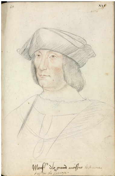
> Portrait d'Artus Gouffier de Bois, Monsieur le Grand maître de France, 1519, bibliothèque Méjanes, Aix-en-Provence (domaine public)

Artus Gouffier est né le 6 septembre 1475 à Bois. Il est le fils de Guillaume 1er Gouffier, seigneur de Bois et sénéchal de Saintonge, et de Philippe de Montmorency. Il devient vers 1490 enfant d'honneur de Charles VIII et se trouve ainsi dans l'intimité du Roi de France.