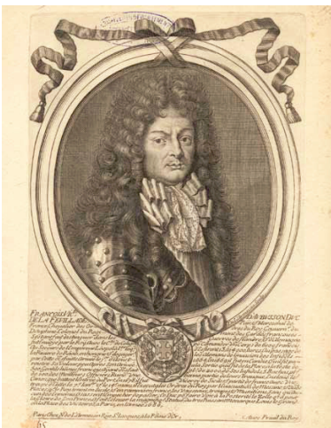
> François d'Aubusson, duc de La Feuillade, portrait gravé par Nicolas de Larmessin

Issu de la famille d'Aubusson, en Limousin, il est maréchal de France sous Louis XIV. Après son mariage avec Charlotte Gouffier en 1667, il hérite de Oiron et du Roannais. Il sera également gouverneur du Dauphiné. Il commande pour Oiron le pavillon des Trophées, ainsi que l'aménagement du terre-plein autour du château et de l'avant cour.