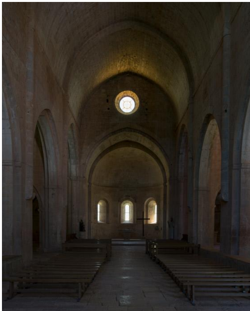
Intérieur de l'Église de l'abbaye du Thoronet